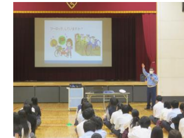
【人間形成 情報モラル】